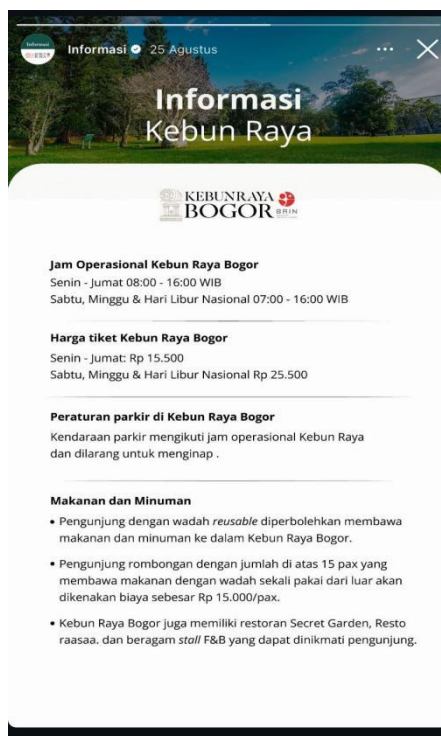
Gambar 3. Tampilan Highlight Operasional Kebun Raya

disimpan secara permanen pada profil sehingga dapat diakses dengan mudah oleh pengguna kapan saja.