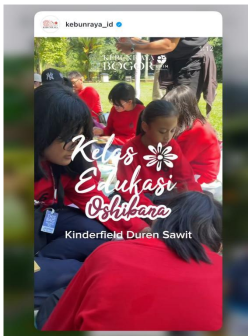
Gambar 5. Recap Kegiatan Kelas Edukasi/ event bulanan ( What's On )