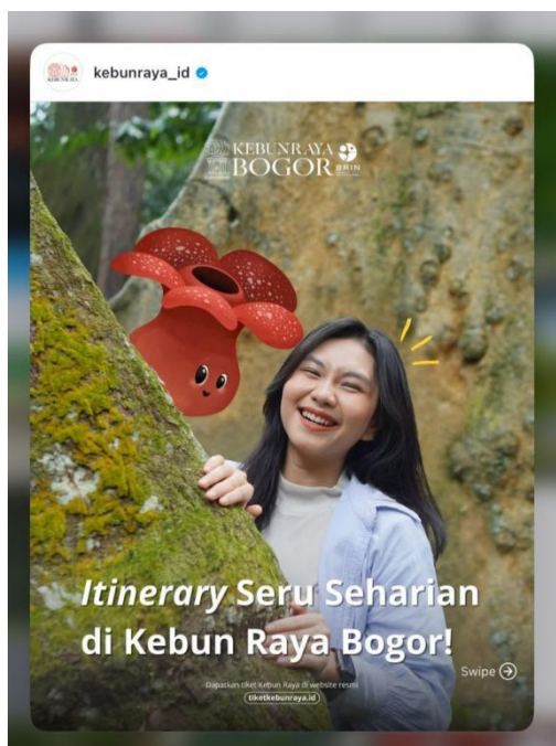
Gambar 4. Spot - Spot Menarik di Kebun Raya

penting dalam membangun citra destinasi serta meningkatkan minat berkunjung masyarakat. Gofar dan Chrismardani (2024) menjelaskan bahwa konten visual destinasi wisata yang disebarakan melalui media sosial mampu menimbulkan ketertarikan emosional calon pengunjung karena memberikan gambaran pengalaman yang dapat diperoleh ketika berkunjung. Dengan demikian, konten visual seperti pada gambar tersebut berfungsi sebagai strategi promosi berbasis pengalaman ( experience-based promotion ).