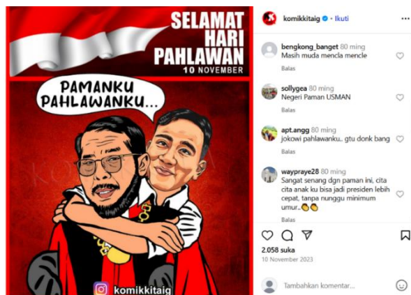
Gambar 3. Pamanku Pahlawanku (Sumber: Instagram @komikkitaig pada 10 November 2023).