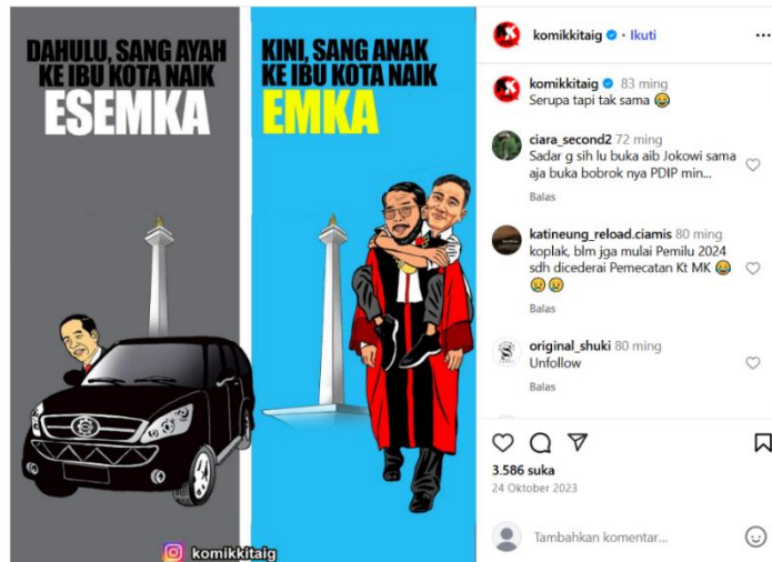
Gambar 2. "Dahulu, Sang Ayah ke Ibu Kota Naik ESEMKA. Kini, Sang Anak ke Ibu Kota Naik EMKA" (Sumber: Instagram @komikkitaig pada 24 Oktober 2023).